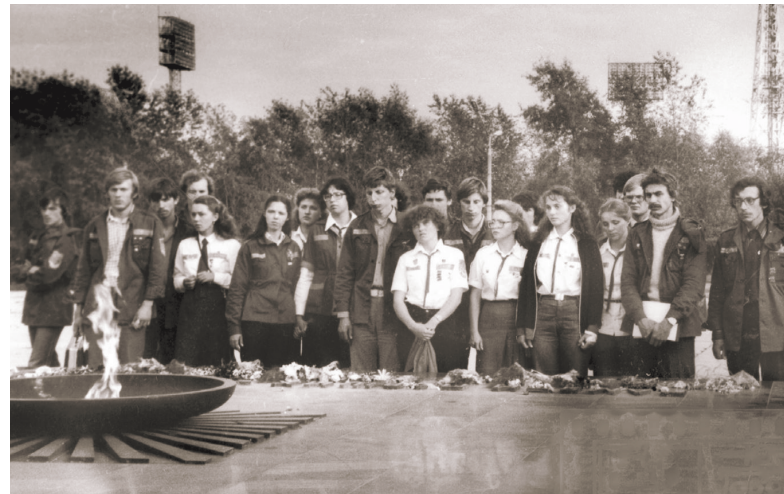
КССО «Товарищ» у вечного огня, г. Сыктывкар, 1982 г.