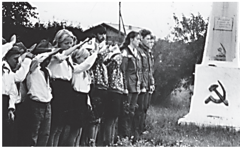
Операция «Память». Бойцы КССО «Товарищ» (Ухтинский индустриальный институт) и воспитанники сыктывкарской школы-интерната № 1 у отреставрированного отрядом памятника павшим в Великой Отечественной войне, с. Чукаиб, 1982 г.

Всегда ваш – комиссар республики Михаил Дронов.