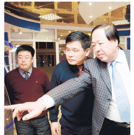
На фото: визит представителей Ляонинского университета в УГТУ, 2009 г.

Стоит отметить, что ухтинский нефтегазовый вуз и его «коллегу» из КНР в прошлом уже связывали конструктивные партнерские отношения, включая программы академического обмена.