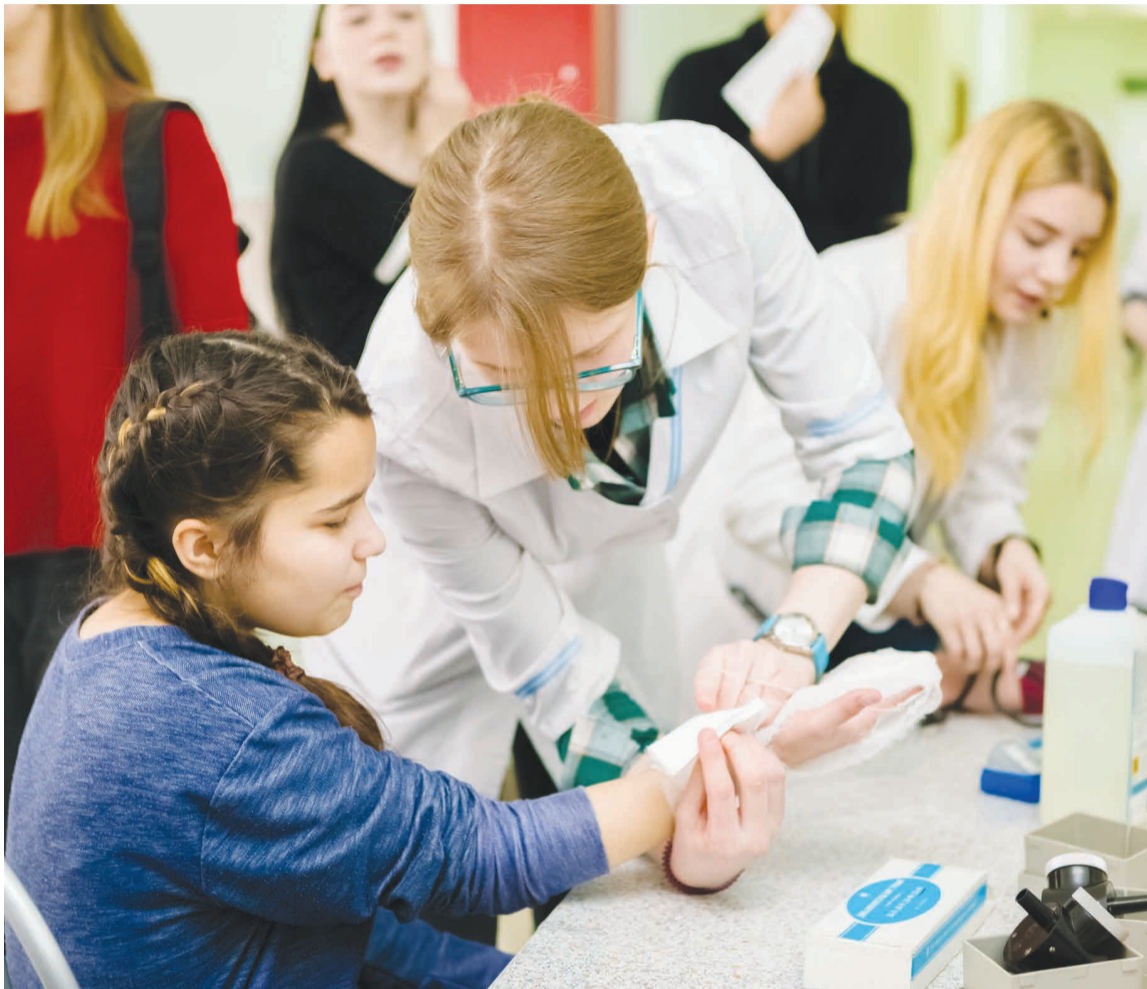
Студенты-медики предупреждают: медицина — дело ответственное!