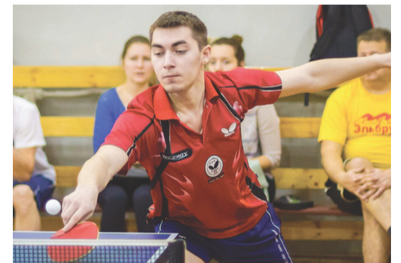
ФОТОФАКТ Сергея СОКОЛОВА