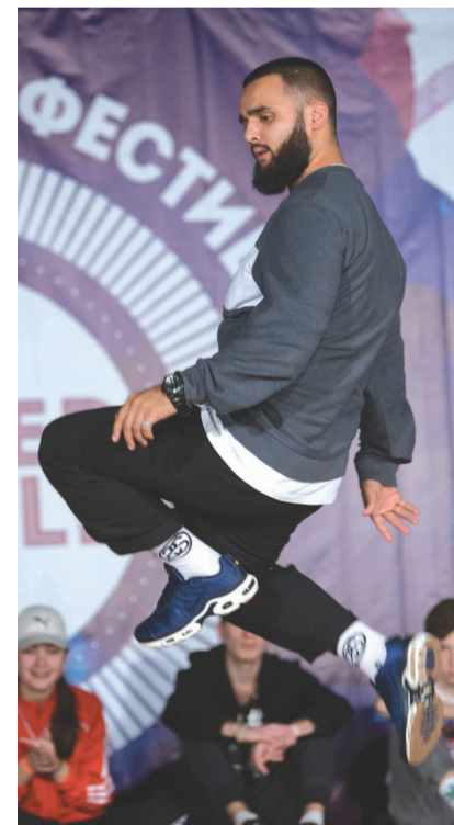
Телеграфируем: Тадж. Махал. Руками. Ногами. Энергично.