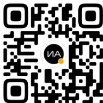
ИНФОРМАЦИОННОЕ АГЕНТСТВО УГТУ