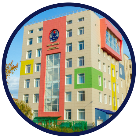
Бизнес-инкубатор УГТУ ул. Сенюкова, 17 Тел.: 738-717