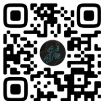
СТУДЕНЧЕСКИЙ СОВЕТ УГТУ