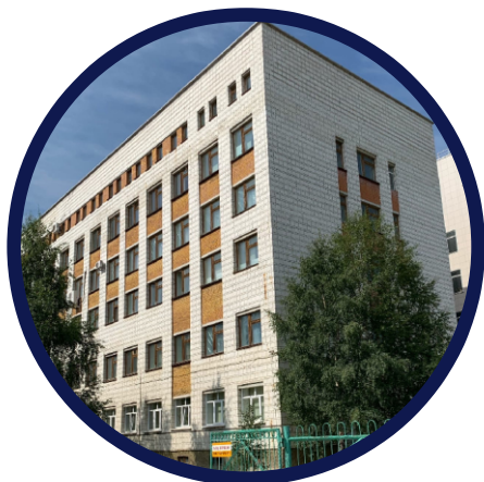
Корпус «К», ул. Сенюкова, 15