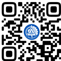
РОССИЙСКИЕ СТУДЕНЧЕСКИЕ ОТЯДЫ