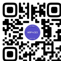
Отдел по УВРидД УГТУ

Больше информации о студенческих объединениях можно узнать на сайте университета в разделе «Жизнь УГТУ».