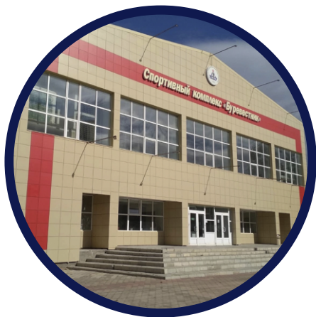
Спортивный комплекс «Буревестник» ул. Юбилейная, 22