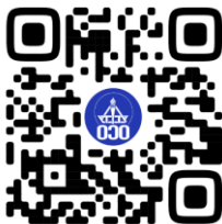
ОБЪЕДИНЕННЫЙ СОВЕТ ОБУЧАЮЩИХСЯ