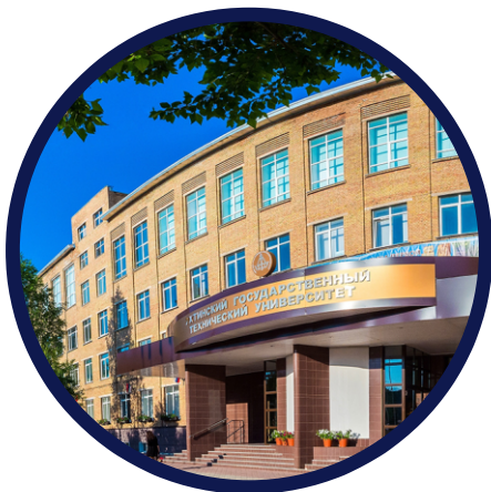
Корпуса «А», «Б», «В», «Г» ул. Первомайская, 13