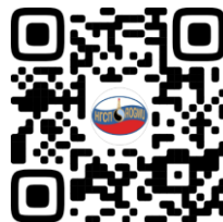
СТУДЕНЧЕСКАЯ СЕКЦИЯ ПРОФСОЮЗА