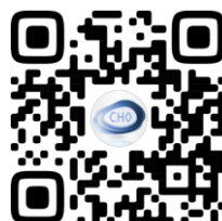
СТУДЕНЧЕСКОЕ НАУЧНОЕ ОБЩЕСТВО