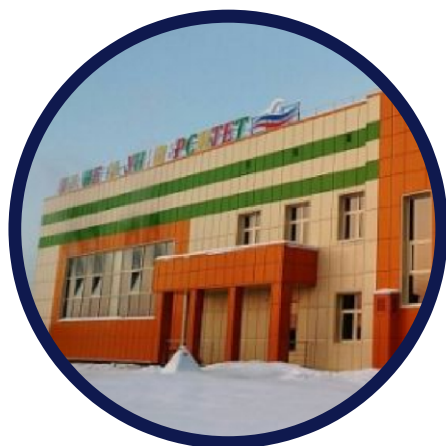
Плавательный бассейн «Планета-университет» ул. Первомайская, 44а