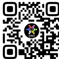
СОВЕТ ВОЛОНТЕРСКИХ ОБЪЕДИНЕНИЙ