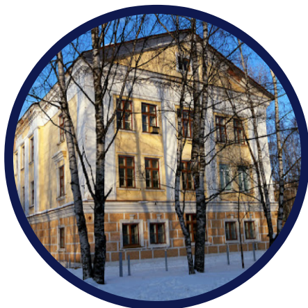
Корпус «Д» ул. Первомайская, 9