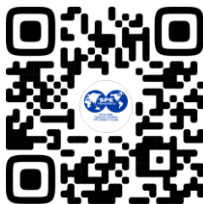
USTU SPE STUDENT CHAPTER