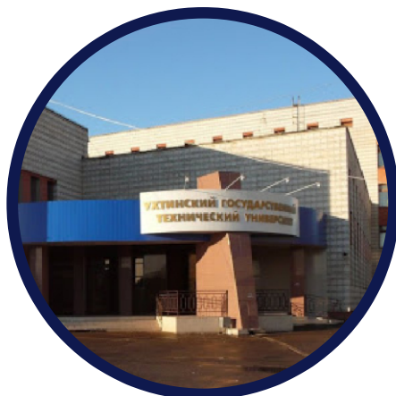
Корпус «Л», ул. Сенюкова, 13